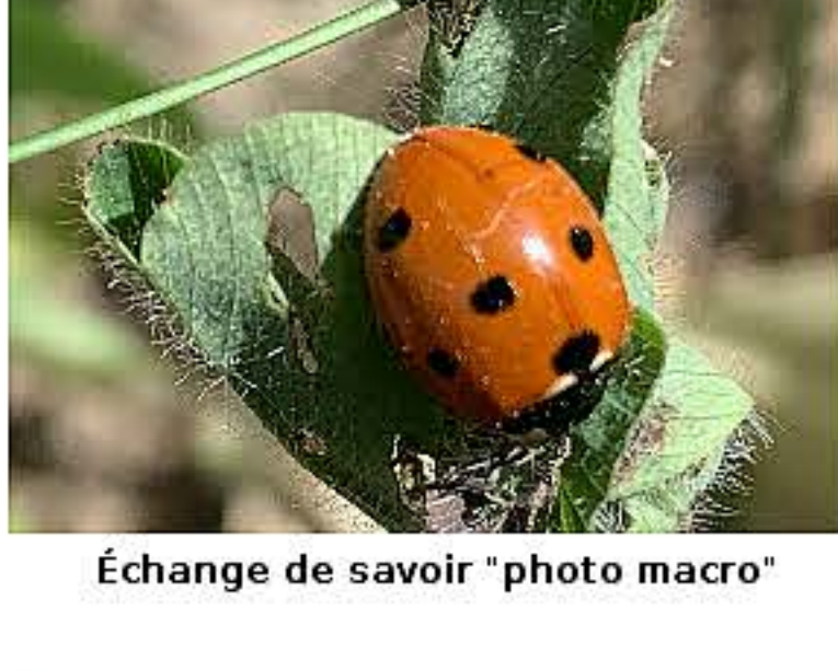
Échange de savoir "photo macro"

Le printemps est là, l'épidémie a l'air de fléchir et l'optimisme revient. Bien sûr nous restons prudents et maintenons les gestes barrières mais nous allons reprendre de manière assidue nos échanges de savoirs en présence et en convivialité : avez-vous des idées pour marquer un redémarrage avant l'été ?