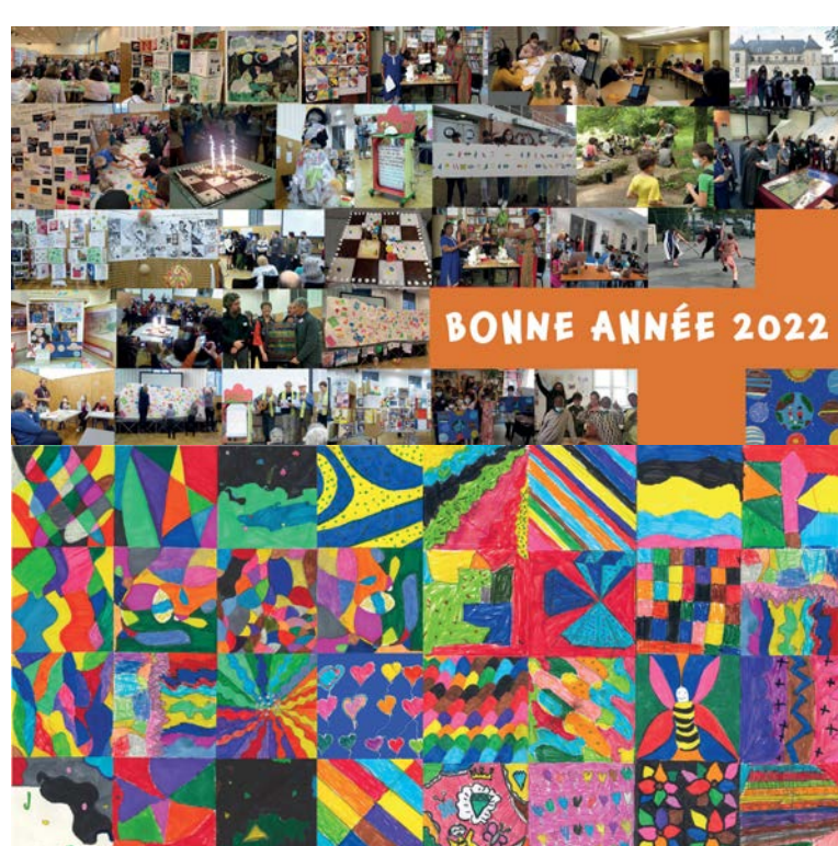
Oeuvre collective réalisée par les enfants du CLAS RERS Le Canal et Les Passages centre-ville