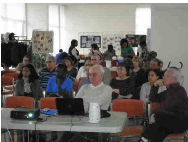
Des participants à l'AG 2012